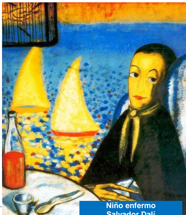
Niño enfermo Salvador Dalí